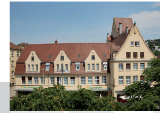
Augen-Praxis-Klinik Adlerstr. 6 (Kiesstr. 1)

Schwäbisch Gmünd, Winnenden, Fellbach, Waiblingen, Stetten